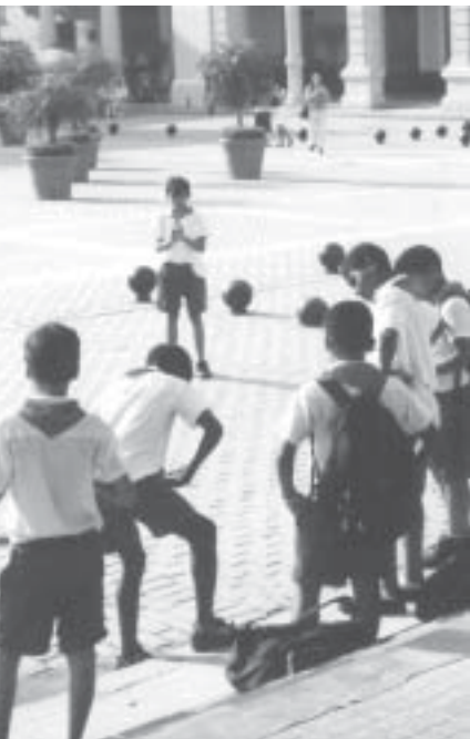
Kubanische Schüler

Petra Pau, MdB, spricht am Montag, dem 22. September, um 19.00 Uhr im „Roten Laden“ zum Thema „Wird Deutschland am Hindukusch und am Euphrat verteidigt?“ Die Berliner Politikerin diskutiert mit Ihnen über die Außen- und Sicherheitspolitik der rot-grünen Bundesregierung. Die PDS begeht den „Tag der deutschen Einheit“ traditionell mit einem „Einheitsmarkt“ . Treffpunkt: 3. Oktober von 11- 20.00 Uhr auf dem Schloßplatz (Mitte).